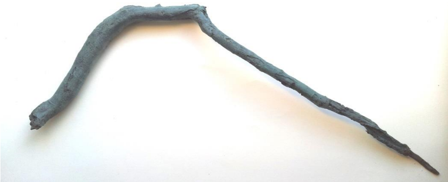
Pièce unique en bronze sur base d'un bois flotté trouvé en bord de Garonne 2016.