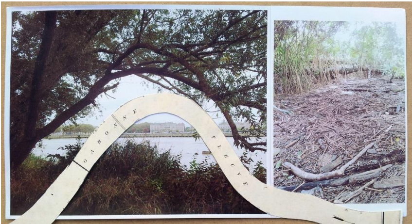
Strate 2 du tiroir latéral de la « Table du CARTographe ARTpenteur » établissant les correspondances visuelles et fluences entre fleuve, branche, bois et trouvaille.

Le lieu où fut trouvé ce bois de flottage rive droite. La forme étrange de la courbure de branche annonce le bras du fleuve et le serendipity de la trouvaille à son pied. Ici le fleuve a imagé, formalisé et objectivé comme une mémoire de son méandre Sous l'action de l'eau irriguant le bois de ce végétal qui tous les jours le boit de ses racines à la moindre feuille. Occurrences surprenantes serendipity fascinant.